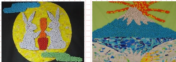
模造紙サイズの立体的な「季節のかざり絵」が完成!!