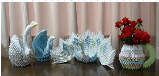
「白鳥」「クジャク」「花びん」完成!!